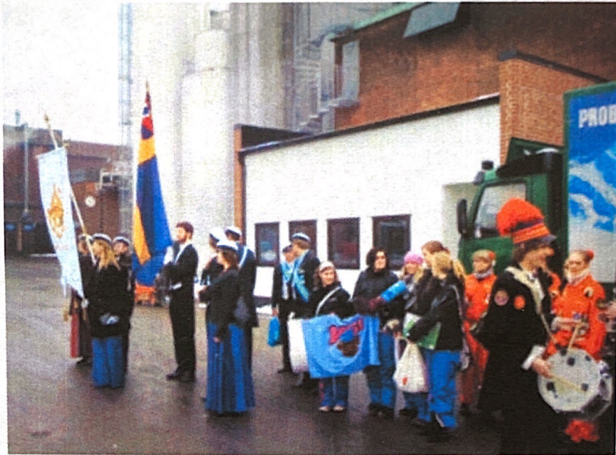
Spex på Carlsberg. Med blåsorkester och fanor tågade Chalmers studentkår in på bryggeriets område och underhöll personalen med orkestermusik, spex och balett. Efter förhandlingar står det klart att Carlsberg börjar bygga en pipeline från Falkenberg.